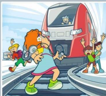
Плеер и железная дорога — несовместимы!