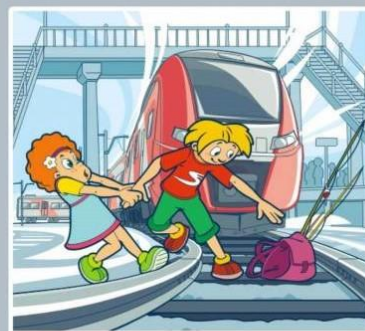
Нельзя переходить пути в неполюженном месте!