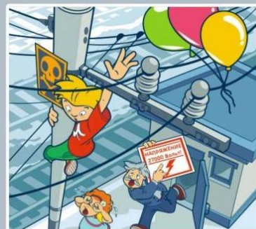
Приближаться к проводам меньше чем на 2 метра — смертельно опасно!