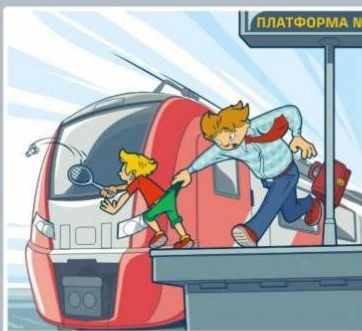
Платформа — не место для игр!