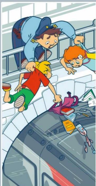
Проезд на крышах и подножках поездов — может стоить жизни!